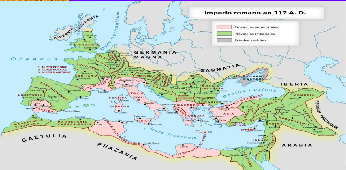
Mapa del Imperio romano a principios del siglo segundo