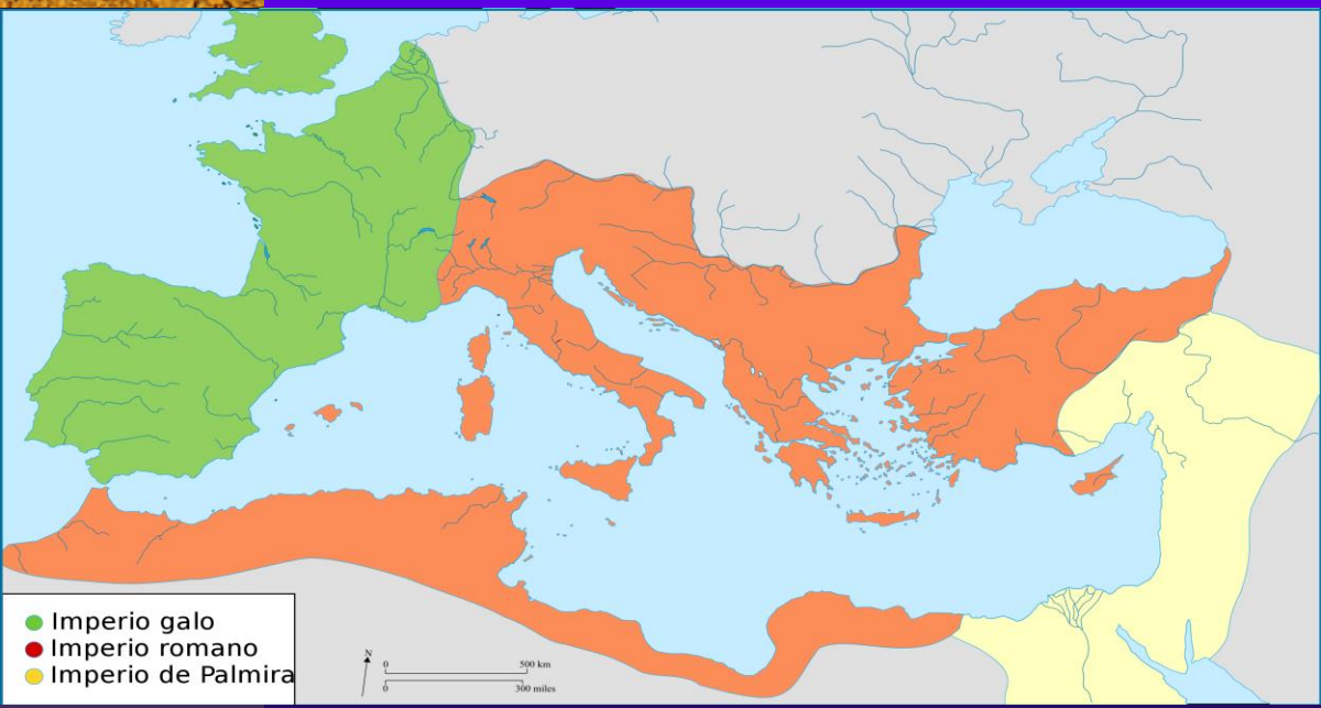
División del Imperio en entre el 260 y el 269 d. C